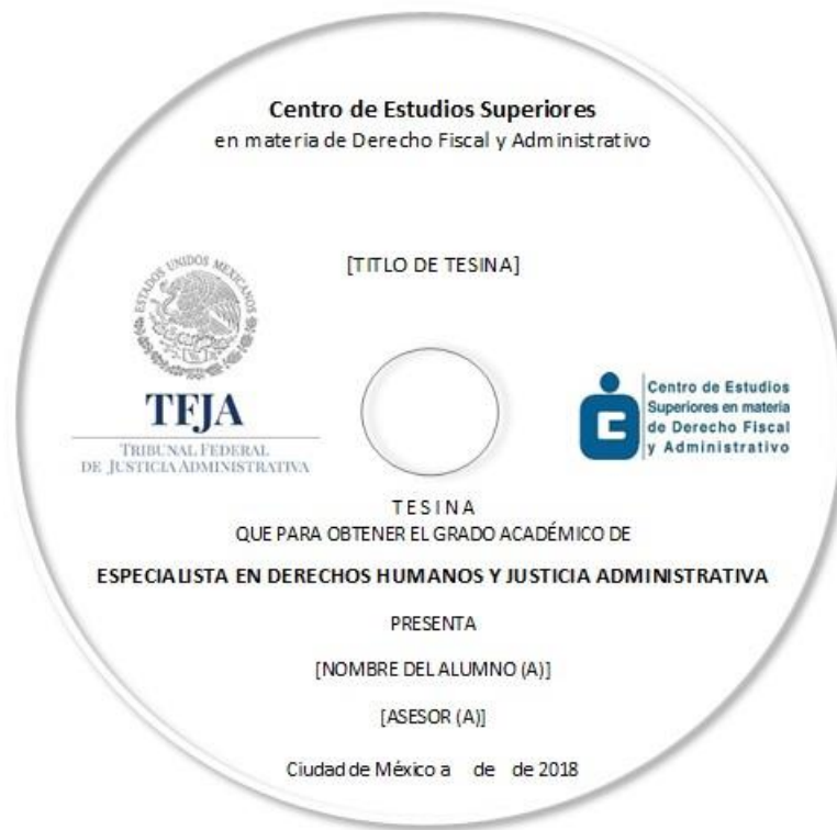
Ejemplo del rotulado en CD