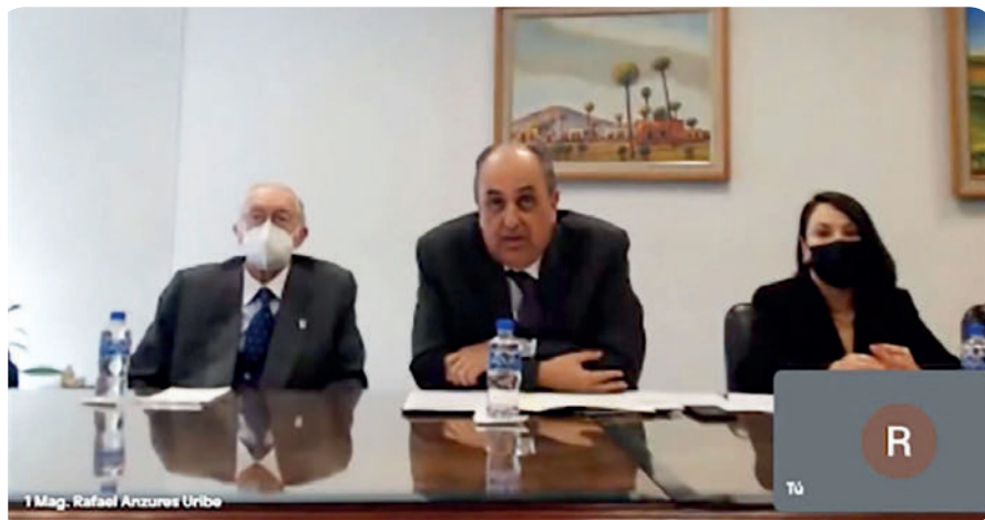
Ceremonia Virtual Toma de Protesta Posgrado-Centro de Estudios Superiores TFJA