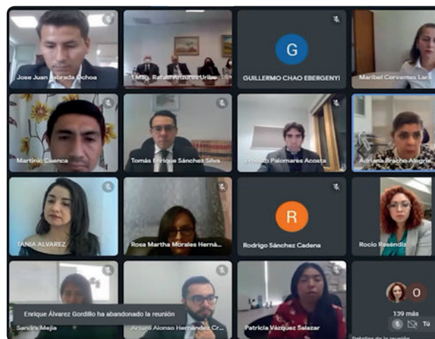
Ceremonia Virtual Toma de Protesta Posgrado Centro de Estudios Superiores TFJA