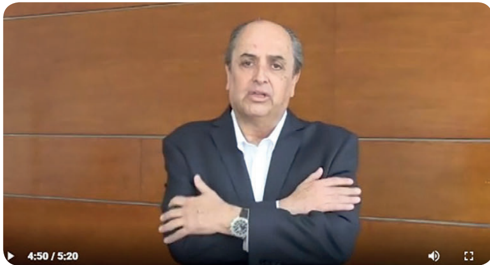
04-01-2021 Mensaje del Magistrado Presidente