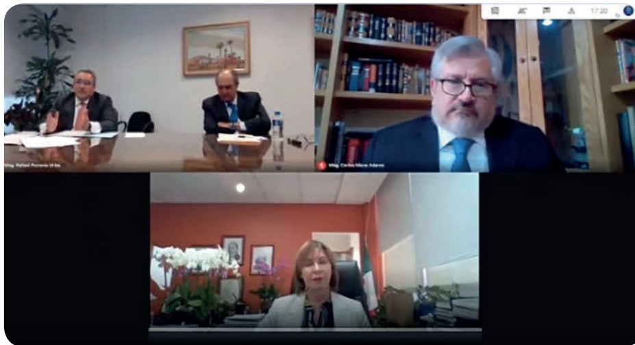
1.er Foro Virtual de Defraudación Fiscal