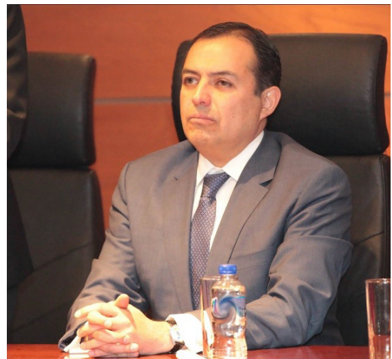
Senador Ernesto Cordero Arroyo, Presidente de la Mesa Directiva de ese Órgano Legislativo Federal.