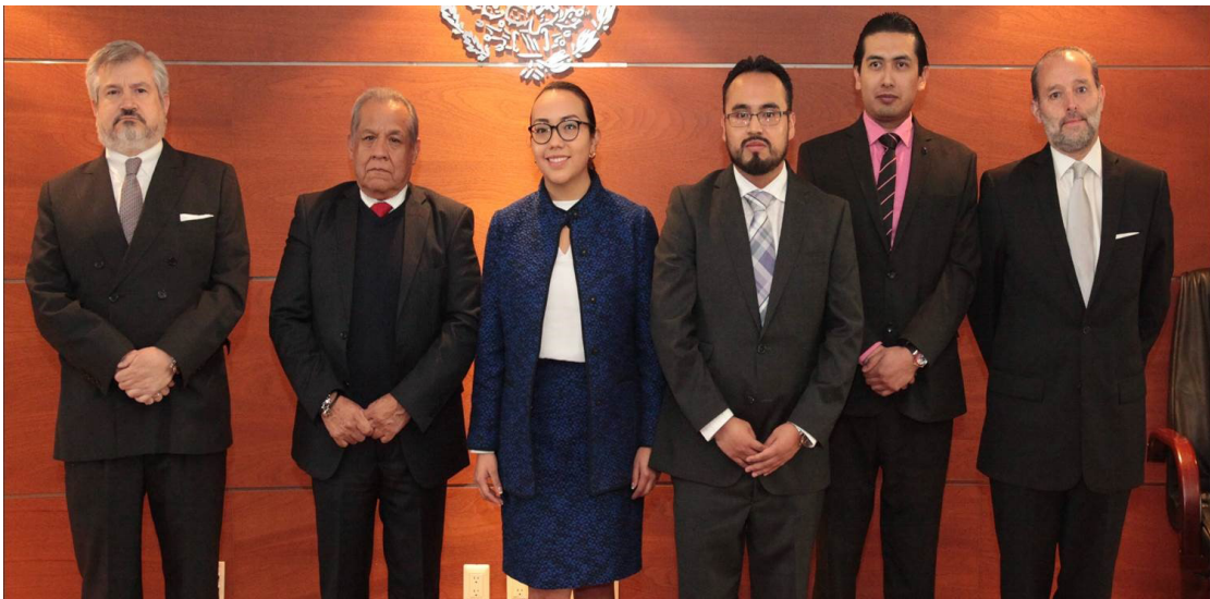
Los egresados de la Maestría en Justicia Administrativa, con autoridades académicas y jurisdiccionales del Tribunal Federal de Justicia Administrativa, en la ceremonia de toma de protesta como Maestros en Justicia Administrativa.