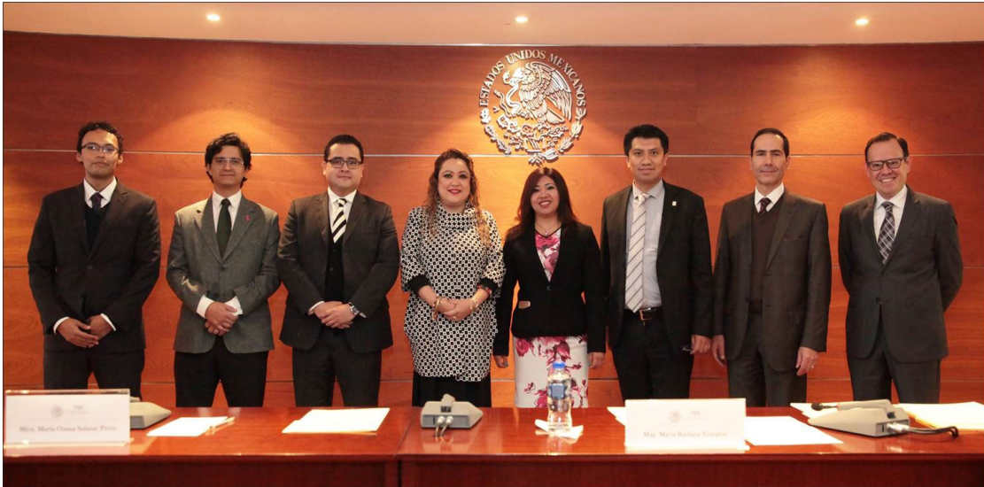
Egresados de la Especialidad en Justicia Administrativa, con autoridades jurisdiccionales y académicas del Tribunal Federal de Justicia Administrativa, en la ceremonia de protesta para recibir el grado académico de Maestros en Justicia Administrativa.