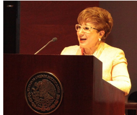
El Ministro Presidente de la SCJN, Don Luis María Aguilar Morales (izquierda) y la Ministra Dra. Margarita Beatriz Luna Ramos (derecha), pronunciando sus mensajes alusivos a la conmemoración del Día Internacional de la Mujer 2018, en el TFJA.

Aclaró que el empoderamiento de la mujer no significa, bajo ninguna perspectiva, restar participación a los varones que los destituya, sino que es la autodeterminación de la mujer con respeto a sus cualidades y derechos.