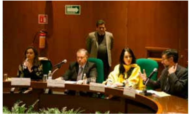
La autora y comentadores del libro " De la Responsabilidad Patrimonial del Estado a la Remediación de su Actividad Irregular ".

en nuestro país, haciendo sea una guía de lo que ha pasado, y que es lo que se prevé que deberá pasar, más los cambios que deberán efectuarse.