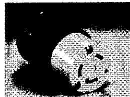
Conectores NEMA L6-30R